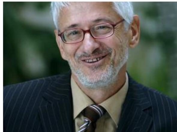
Der Autor Ulrich Sollmann

Beim Clinton-Foto spielt das keine Rolle. Geht es doch offensichtlich nicht um das Foto, nicht darum, ob Hillary Clinton Angst hatte, einen allergischen Schub oder sonst irgendwas. Das Clinton-Foto stiftet zur Identifikation an. Das ist nicht zu übersehen, das ist nicht zu überhören. - Warum also dieses Bildbetrachtungstheater? Warum nicht darüber reden, dass man selbst vielleicht in einer solchen Situation Angst gehabt hätte? Oder erstarrt wäre. Oder eine uneingestandene Freude, wie sie durch die Kanzlerin Merkel spontan in Worte gebracht worden war. Warum sich also nicht eingestehen, dass einen das ganze Bildtheater kalt lässt, weil es doch viel wichtigere Dinge zu berichten gibt?